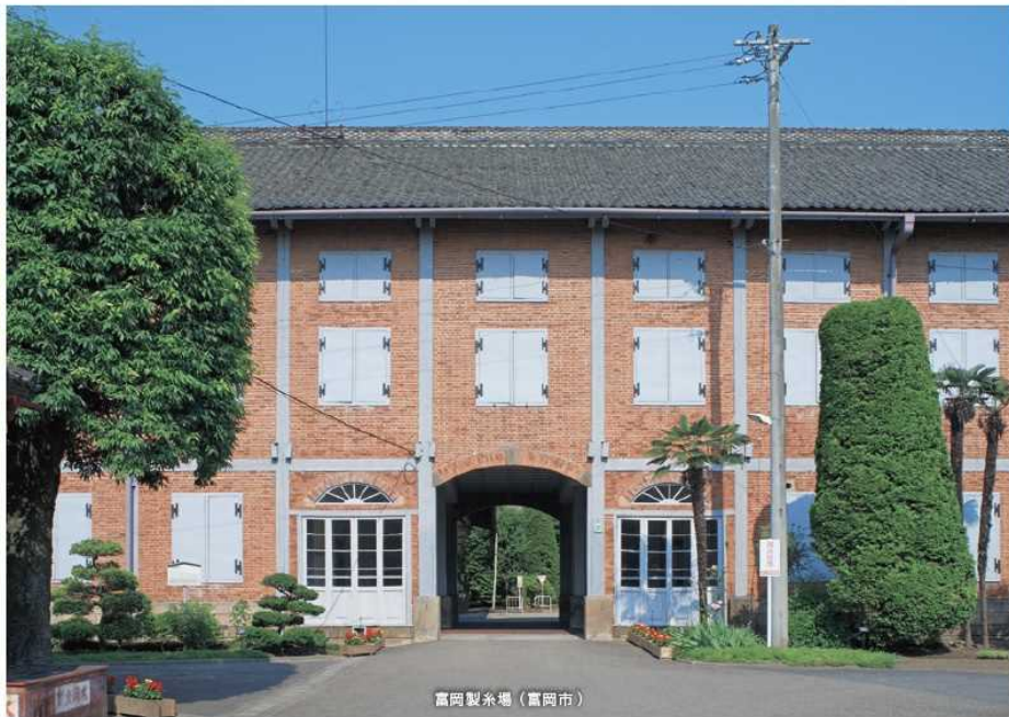
富岡製糸場 (富岡市)