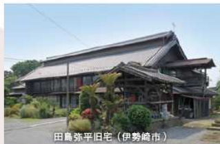
田島弥平旧宅 (伊勢崎市)

回答いただいた方の中から抽選で 10名様 に、 群馬県の特産品詰め合わせ 1万円相当 をプレゼント！