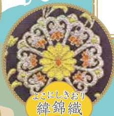
よこにしきおり 緯錦織