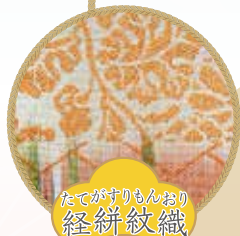
たてがすりもんおり 経緋紋織