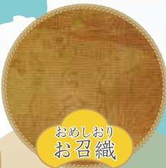
おぬしおり お召織