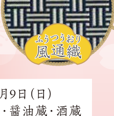
ふりつうおり 風通織