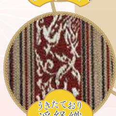
うきたており 浮経織