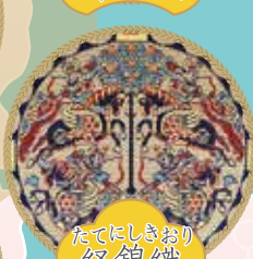
たてにしきおり 経錦織