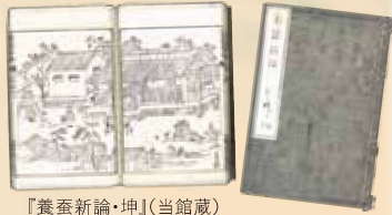
『養蚕新論・坤』(当館蔵)