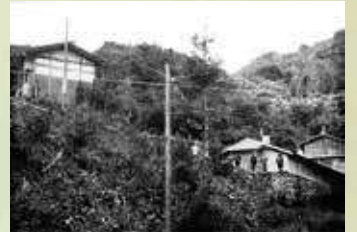
管理棟と風穴(明治43年「北甘楽郡案内」より、下仁田町歴史館所蔵)

風穴の管理棟と、7kmほど離れた所にあった事務所「春秋館」の間には私設電話が引かれていました。この写真には電話線と柱が写っています。