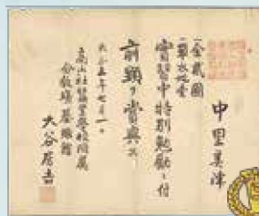
高山社蚕業学校 大谷分教場褒状(当館蔵)

高山社蚕業学校では、 実習中、特に励んだ生徒に... お金と着物が贈られていた!!