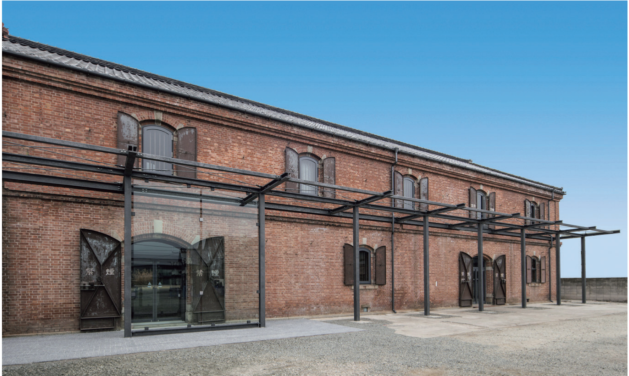
群馬県立世界遺産センター