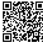
ぐんま電子申請受付システム

下記番号宛に「氏名」、「電話番号」、「人数」、「春秋館見学希望の有無」を明記して送信してください。 FAX: 0274-67-7822