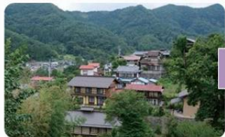
永井流養蚕伝習所実習棟(片品村) 片品村重要文化財