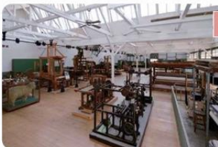
織物参考館“紫”(桐生市) 国登録有形文化財

旧ノコギリ屋根工場などを利用した体験型織物資料館 染色や機織りの体験ができます。