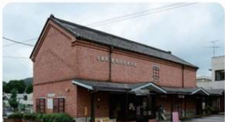
旧小幡組製糸レンガ造り倉庫(甘楽町) 甘楽町重要文化財