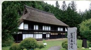
富沢家住宅(中之条町) 国重要文化財

二階に専用蚕室を持つ国内最古級の養蚕農家周辺では今でも養蠶を見ることができます。