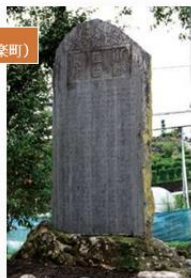
甘楽町の養蚕・製糸・織物資料(甘楽町)

大正初期には約7割の世帯が養蚕農家だった甘楽町で使用された道具や資料道の駅甘楽では座繰り体験ができます。(実施日は要確認)