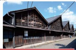
後藤織物(桐生市) 国登録有形文化財

織物業の中心地 江戸時代後期から昭和初期にかけて建てられた絹織物関連の主屋などが建ち並んでいます。