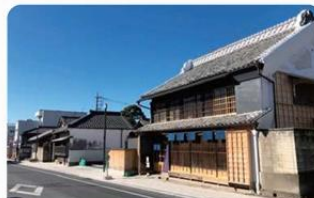
桐生市桐生新町伝統的建造物群保存地区(桐生市) 国重要伝統的建造物群保存地区

織物業の中心地 江戸時代後期から昭和初期にかけて建てられた絹織物関連の主屋などが建ち並んでいます。