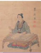
永井いと像(片品村)