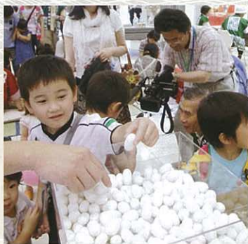
☆無料体験が盛りだくさん!